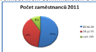
Graf 1: Velikost firem semifinalistek OCP v roce 2011

Z grafu vyplývá, že v souboru semifinalistek v roce 2010 mírně převažovaly větší firmy ve srovnání s rokem 2011. Zde uváděná nejmenší velikostní kategorie, tj. podíl firem s počtem zaměstnanců v rozmezí od 10 do 24, dosahovala v roce 2011 více než polovinu z celkového počtu firem, zatímco v roce 2010 to byla necelá polovina. Podíl firem s největším počtem zaměstnanců byl nepatrně vyšší v roce 2010 než v roce letošním.