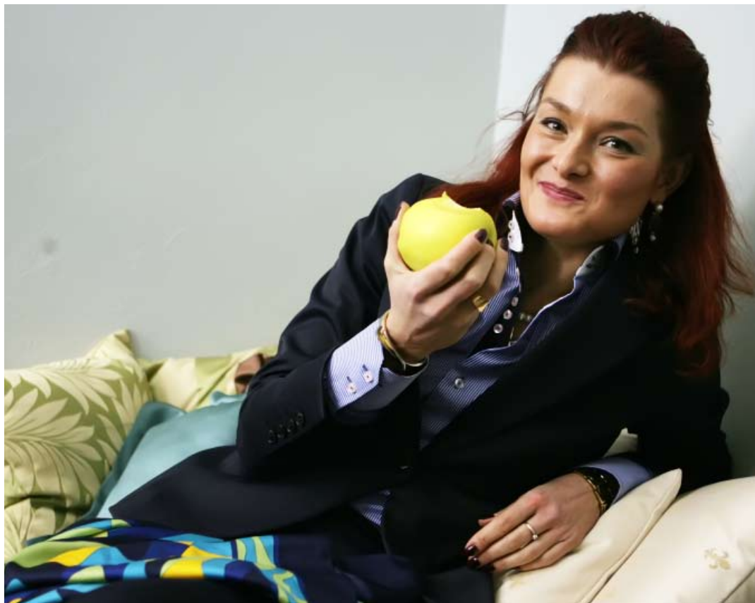
Setkávám se s milými lidmi, hraju golf a medituji. No a občas kousnu do nějakého toho vitamínu.